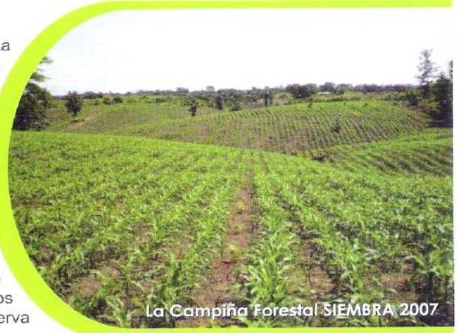
La Campiña Forestal SIEMBRA 2007

Los recursos para este proyecto han sido aportados ya en su totalidad, y de manera paralela al proceso de siembra se inició la preparación del proceso de oferta pública. Al igual que en los proyectos anteriores el proceso de colocación se espera se de en los próximos meses, dándole prioridad a los inversionistas de los proyectos forestales anteriores en la reserva de sus acciones.